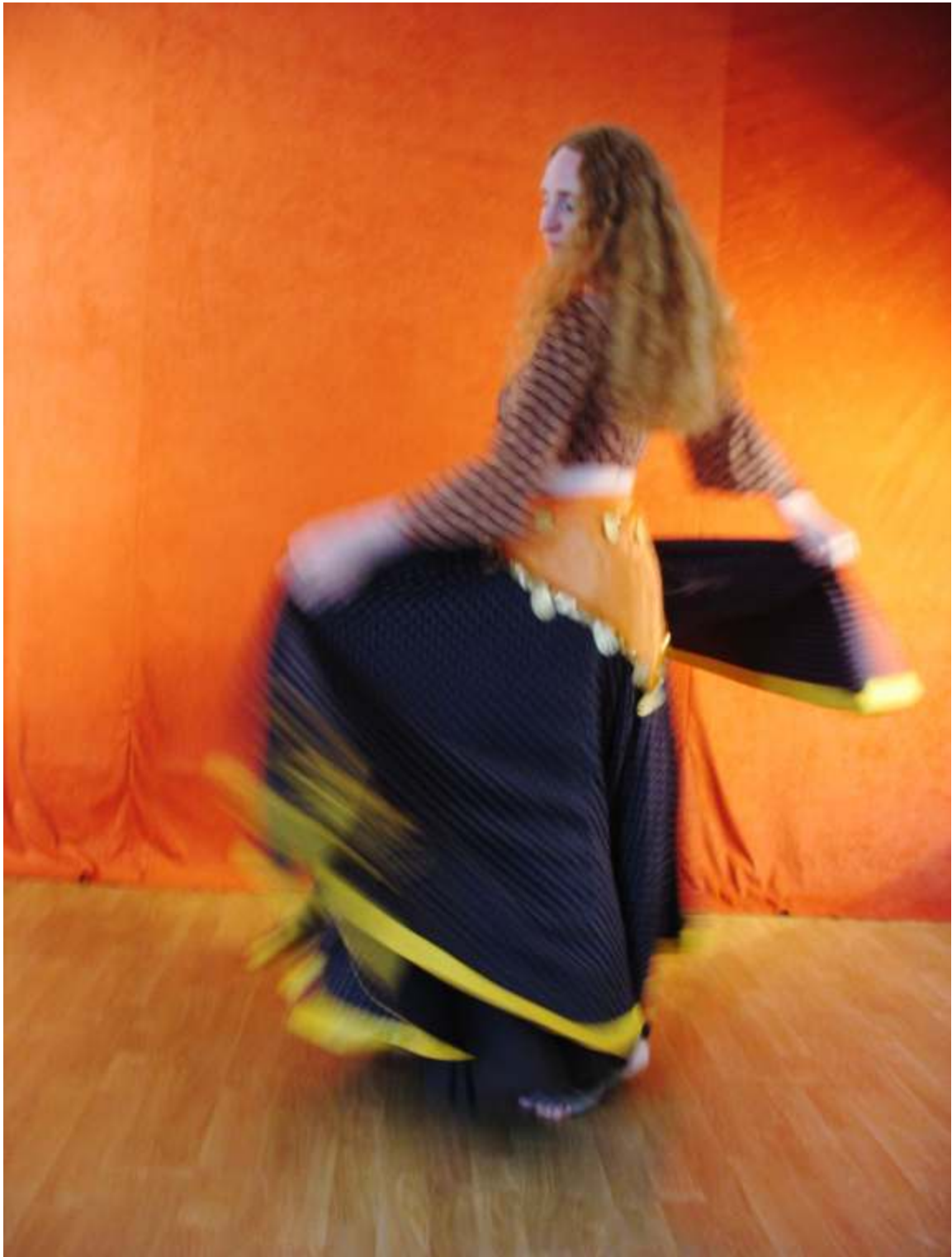
Fotosession 2006, Neveen, Zigeunertanz