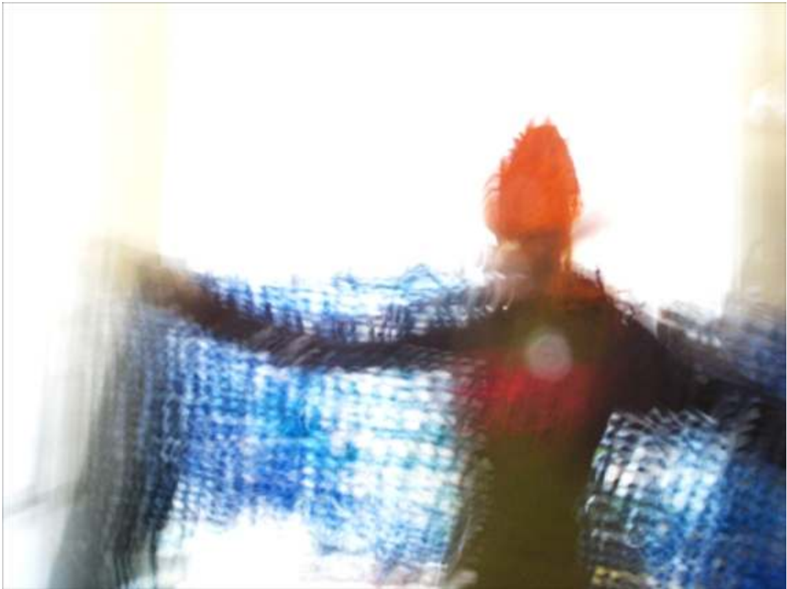
Fotosession 2006, Filzwerkstatt Rumpelfilzchen, Jena

SILHOUETTEN/SCHABLONEN & LICHTMALERIE PORTRAITWERKSTATT BIRGER JESCH