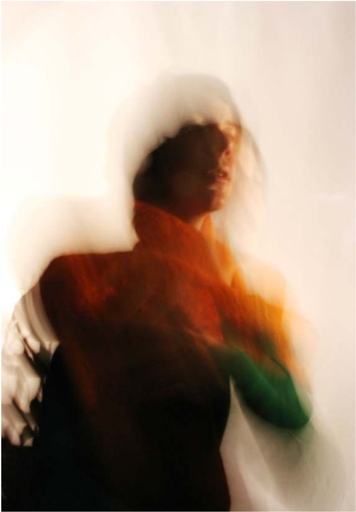
Fotosession 2006, Filzwerkstatt Rumpelfilzchen, Jena