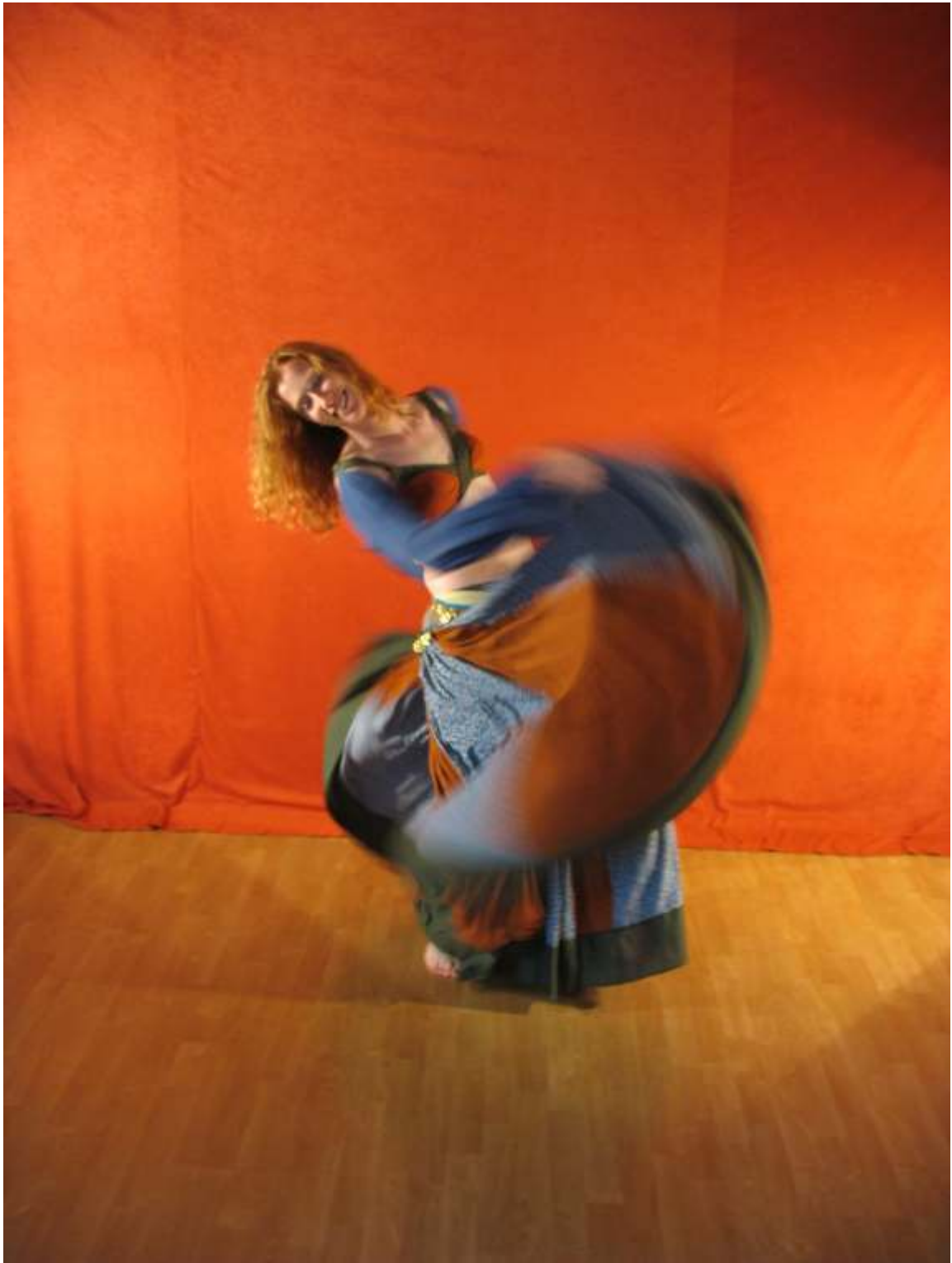
Fotosession 2006, Hashwa, Zigeunertanz