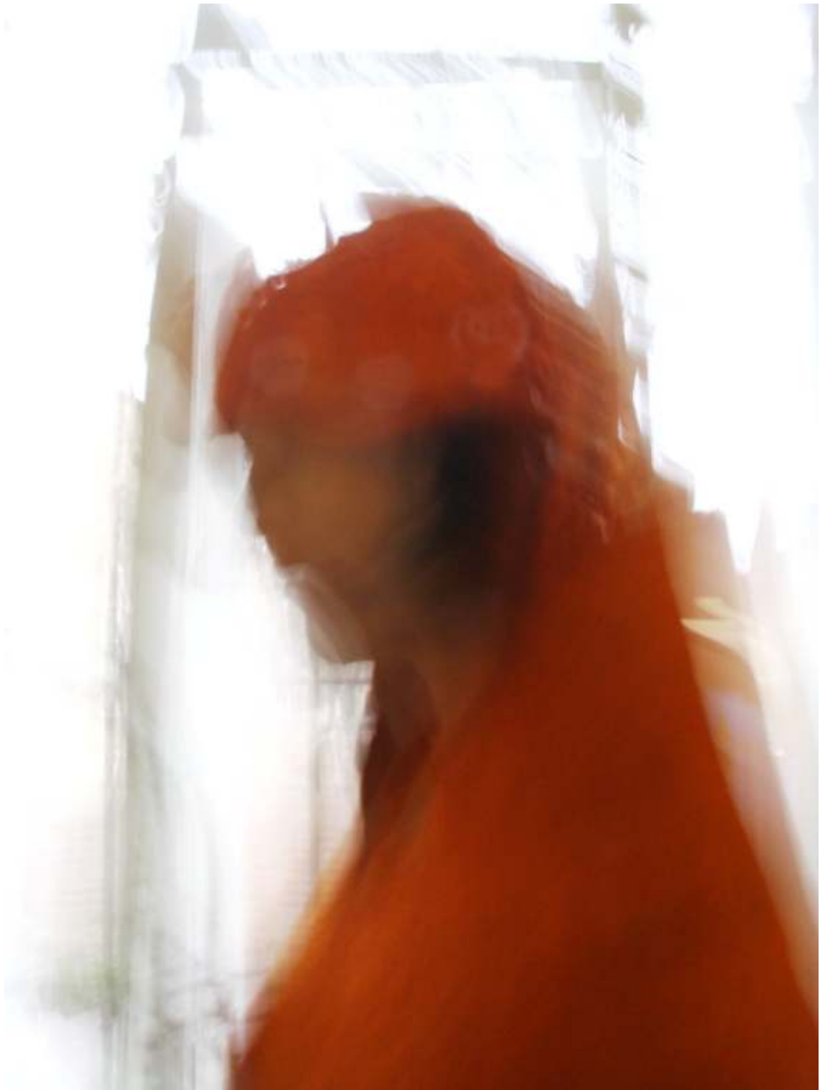
Fotosession 2006, Filzwerkstatt Rumpelfilzchen, Jena