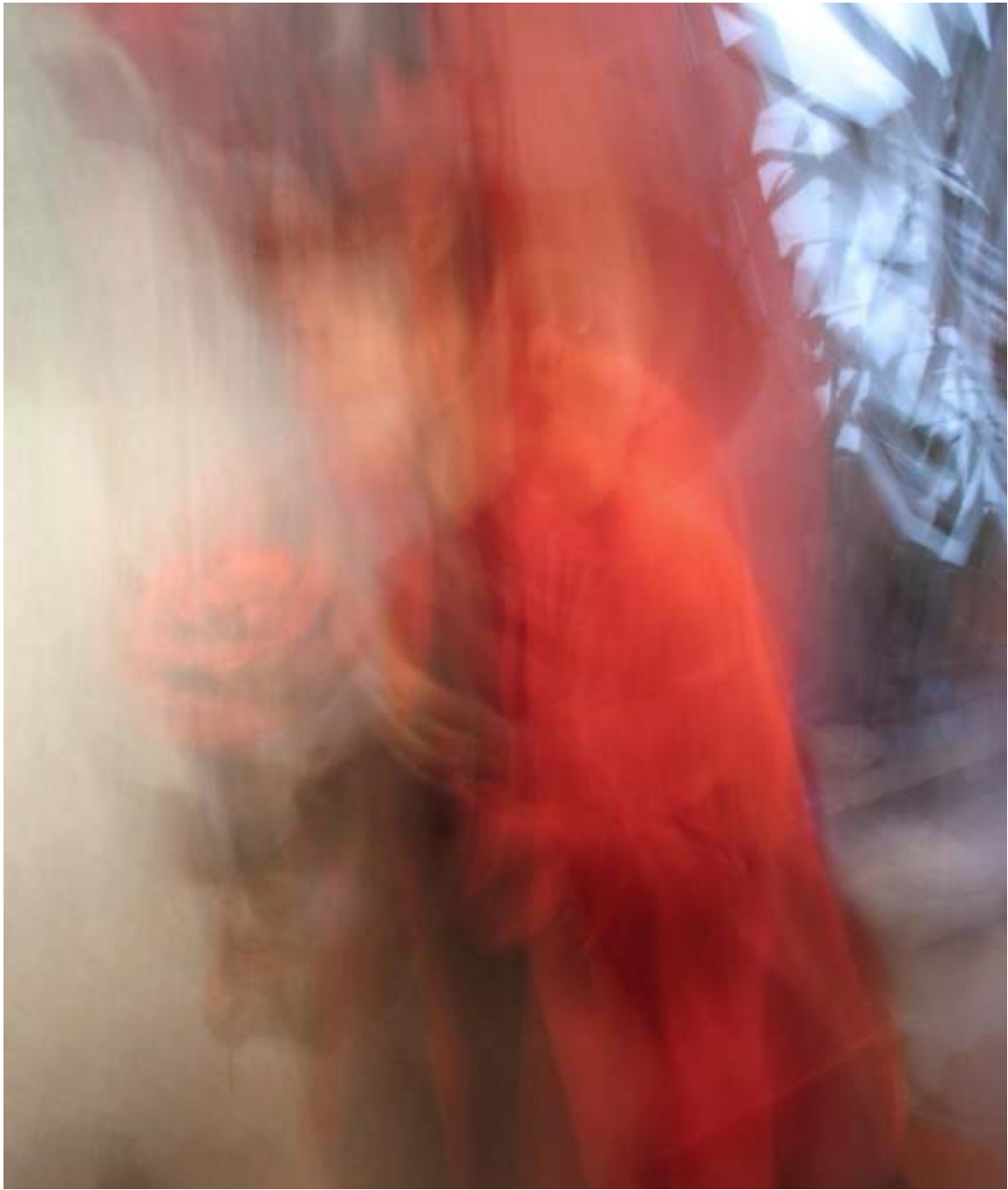
Fotosession 2006, Friederike