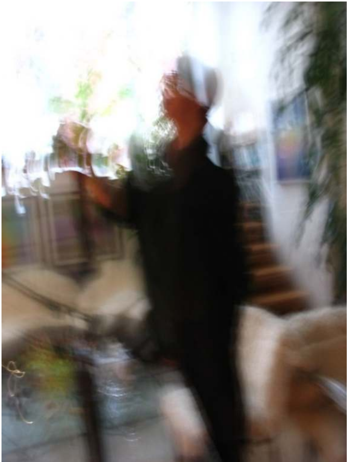
Fotosession 2006, Erfurt